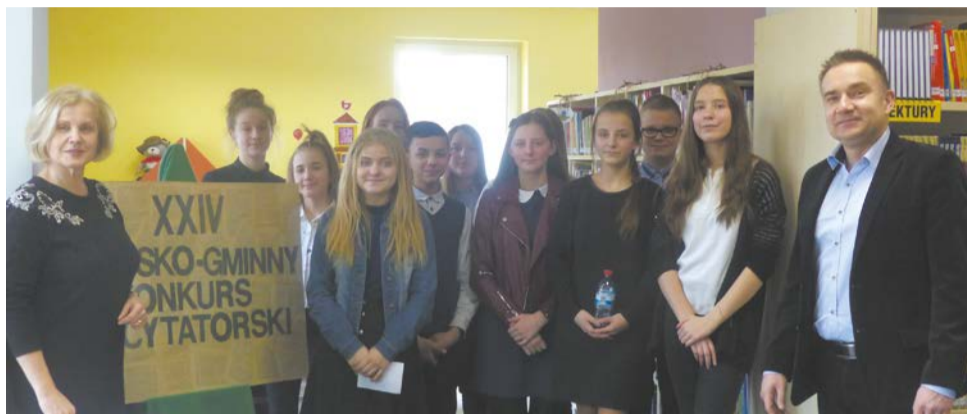
W tegorocznym konkursie udział wzięło łącznie 35 uczniów szkół podstawowych i gimnazjum oraz 6 najmłodszych uczestników z grupy przedszkolnej, występujących poza konkursem.