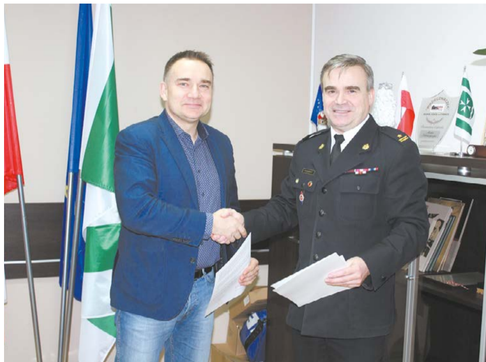
Podpisane porozumienie nawiązuje do ogólnopolskiej kampanii społecznej „Czujka na straży Twojego bezpieczeństwa”.

BEZPIECZEŃSTWO Na zebraniach omówiono sprawną współpracę jednostek z innymi organizacjami i instytucjami