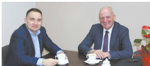
Burmistrz przedstawił problemy, które trapią mieszkańców gminy

AKTYWNI SENIORZY Potrafią się delectować każdym dniem