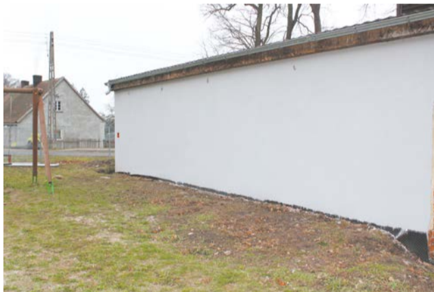
W 2018 roku na terenie Gminy Cybinka w ramach inicjatywy lokalnej przeprowadzono prace w czterech remizach OSP: Cybince, Grzmiącej, Rąpicach i Sądowie