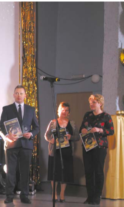
zł statuetki i dyplomy w 7 kategoriach: ia sportu i turystyki, inicjatywa lokalna,