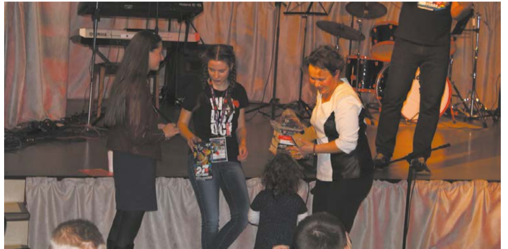
Przekazany przez Burmistrza na licytację „Dzień pracy z Burmistrzem” również znalazł nabywcę, a precyzyjniej nabywczynią, która miała okazję poznać Urząd Miejski w Cybince, pracę Urzędników i na chwilę wcielić się w rolę Burmistrza i zasiąść w jego fotelu.